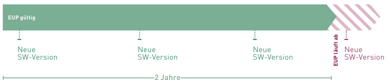
Abb. 1: Die iba-Software-Wartung ist in den ersten zwei Jahren nach Erwerb der Lizenz kostenfrei.